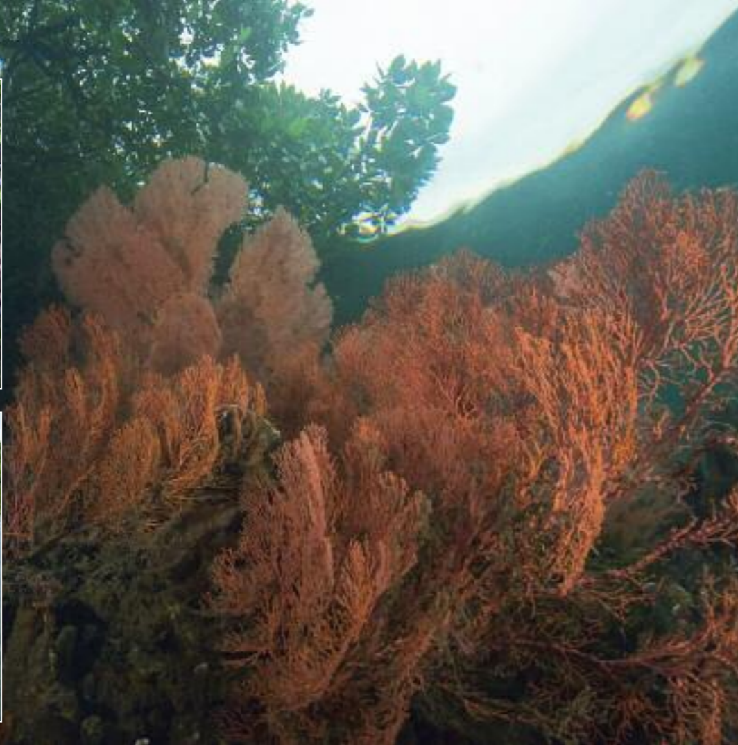
De riffen lopen op veel plaatsen naadloos over in mangrovebos. Prachtige waaierkoralen groeien tussen en op de wortels van de mangroves

wust te maken van het belang van een gezond mariene ecosysteem. Met hun omgebouwde 'educatieschip' varen zij het hele jaar door van dorp naar dorp om de jeugd - en via de jeugd de ouders en dus de plaatselijke vissers - bewust te maken van de nadelen van destructief vissen en het belang van gezonde riffen.