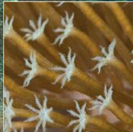
Lederkoraal in groothoek en macro (inzet)