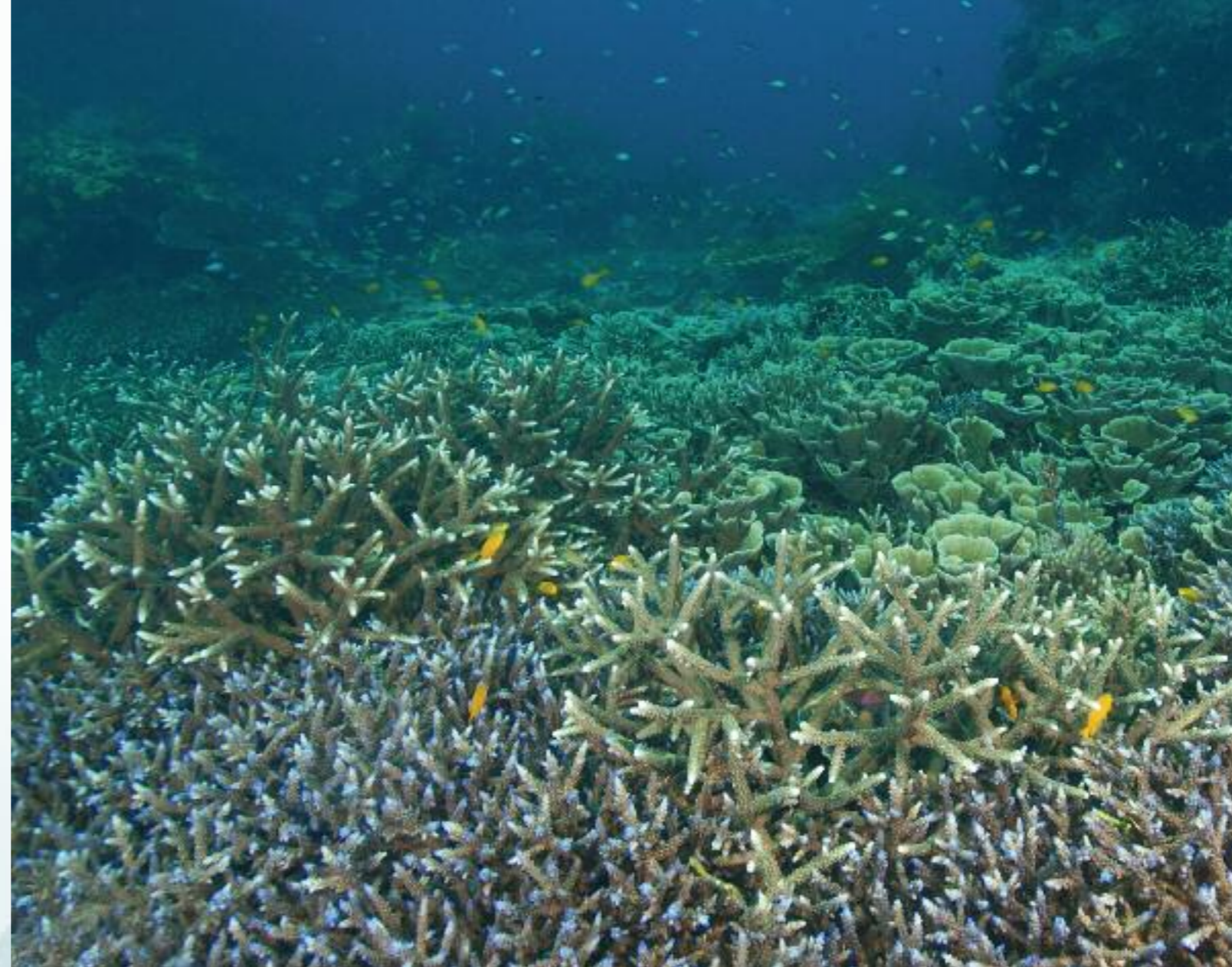
Indrukwekkende velden met het tere herts-hoornkoraal

Het is ook oppassen geblazen voor de mangrovebossen zelf. Vooral inwoners van het niet al te verafgelegen Sulawesi, komen niet alleen vissen in dit gebied, maar kappen er ook de