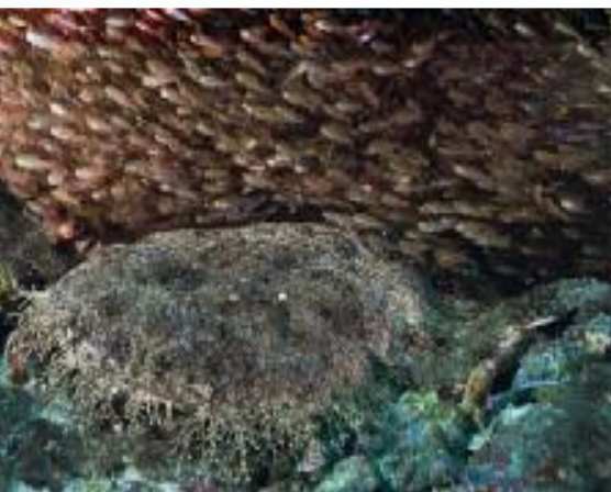
Wobbegong of geklepte bakerhaai

De meest algemene haai die overigens zelden wordt gevangen, is de Wobbegong shark (geklepte bakerhaai). Meestal onbewogen liggend in een grotje, vaak omgeven door glasvisjes, wacht de haai op een voorbijzwemmende prooi. Opvallend is het kleine oog van de haai. Het dier is perfect gecamoufleerd door de vlek-